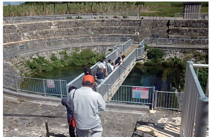
▲福里地下ダム水位水質監視施設研修の様子