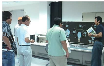
▲中央管理所にて研修の様子