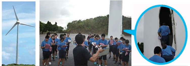
▲風力発電施設 ▲上野中学校見学の様子 こちらから中に入り見学▲