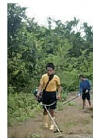
西辺小学校 見学の様子