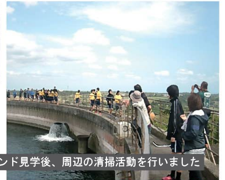
ファームポンド見学後、周辺の清掃活動を行いました