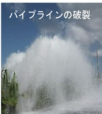
パイプラインの破裂

1987年より造成された用水路は、老朽化にともない一部の用水路においてパイプラインの破損による漏水事故が多発しており、農業用水の安定供給に支障をきたしておりました。