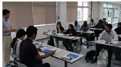
▲JICAによる研修の様子 仲原地下ダム建設現場にて研修の様子▲